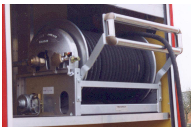
Slangevinde monteret med 4-sidet slange- føringsrulle på nedklappelig stativ