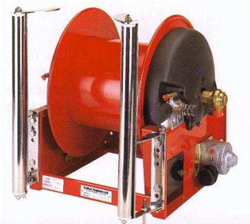
Slangevinde monteret med Sidemonterede slangeføringsruller