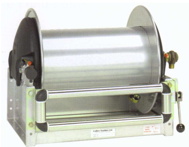
Slangevinde monteret med fastmon- teret 4-sidet slangeføringsrulle