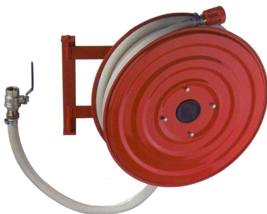
Slangevinde model 2700