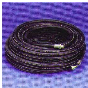
Højtryksslange i gummi.

1" højtryksslange i gummi med 1 stålindlæg