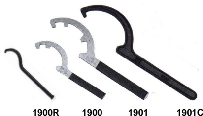
1900R 1900 1901 1901C

1900R Koblingsnøgle for B/C storz, rustfri stål